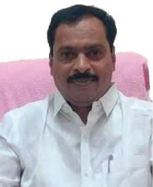
ఆవేదన వ్యక్తంచేశారు. రేవంత్ రెడ్డి ప్రభుత్వం కొలువుదీరిన నాటినుండి అధికార, పోలీసు