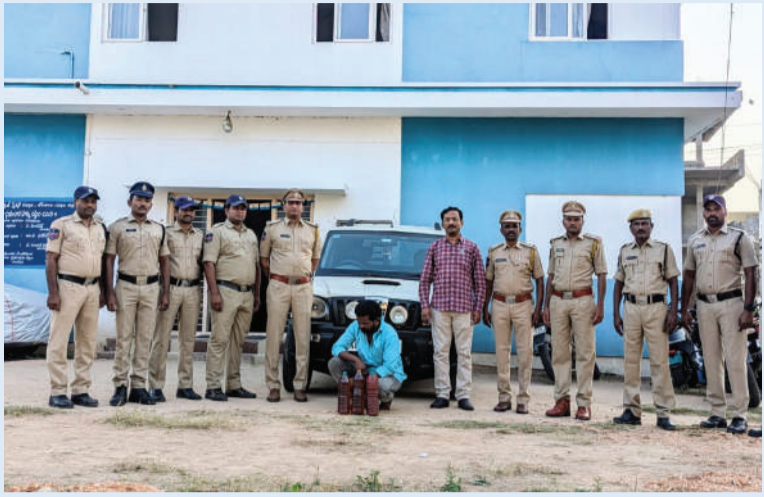
గద్వాల జిల్లా బ్యూరో, నవంబర్ 20 (జర్నలిస్ట్ డైరీ):