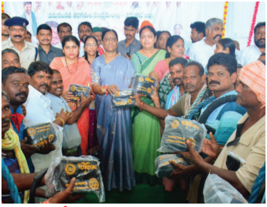
(జర్నలిస్ట్ డైరీ) ప్రతినిధి/పరంగల్: