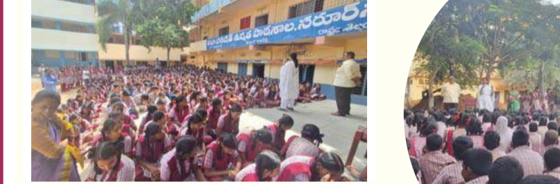
-నరూర్ నగర్ ప్రభుత్వ ఉన్నత పాఠశాల విద్యార్థులకు రాచకొండ ఏహెచ్ఐయూ అవగాహన సదస్సు