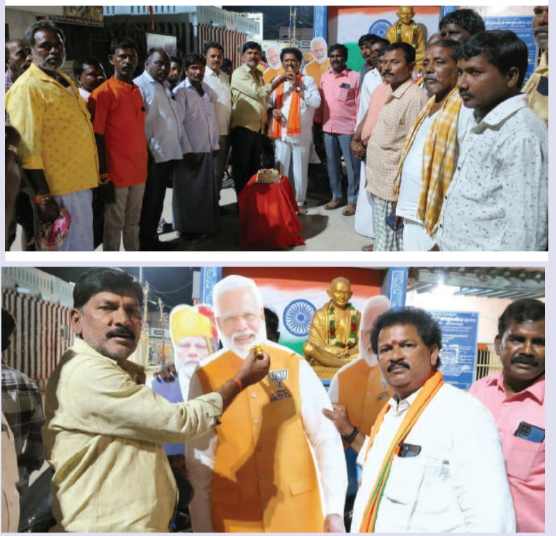
విన్నవించకుంటున్న సెప్టెంబర్ 17 (జర్నలిస్ట్ డైరీ) :