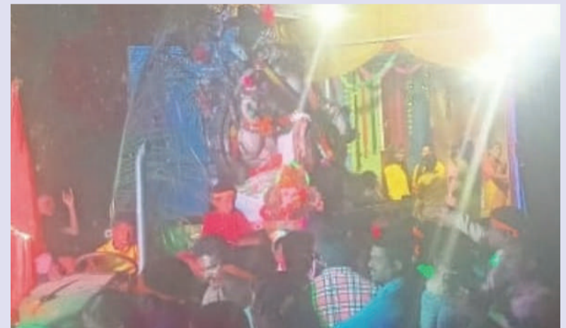
(జర్నలిస్ట్ డైరీ) స్వాస్, ఆచేరు ఆర్డీ: