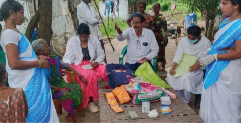
(జర్నలిస్ట్ డైరీ) ప్రతినిధి/చెన్నూర్