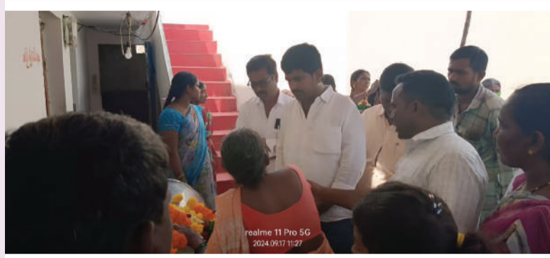
విన్నవించకుంటుంటున్న సెప్టెంబర్ 17 (జర్నలిస్ట్ డైరీ)